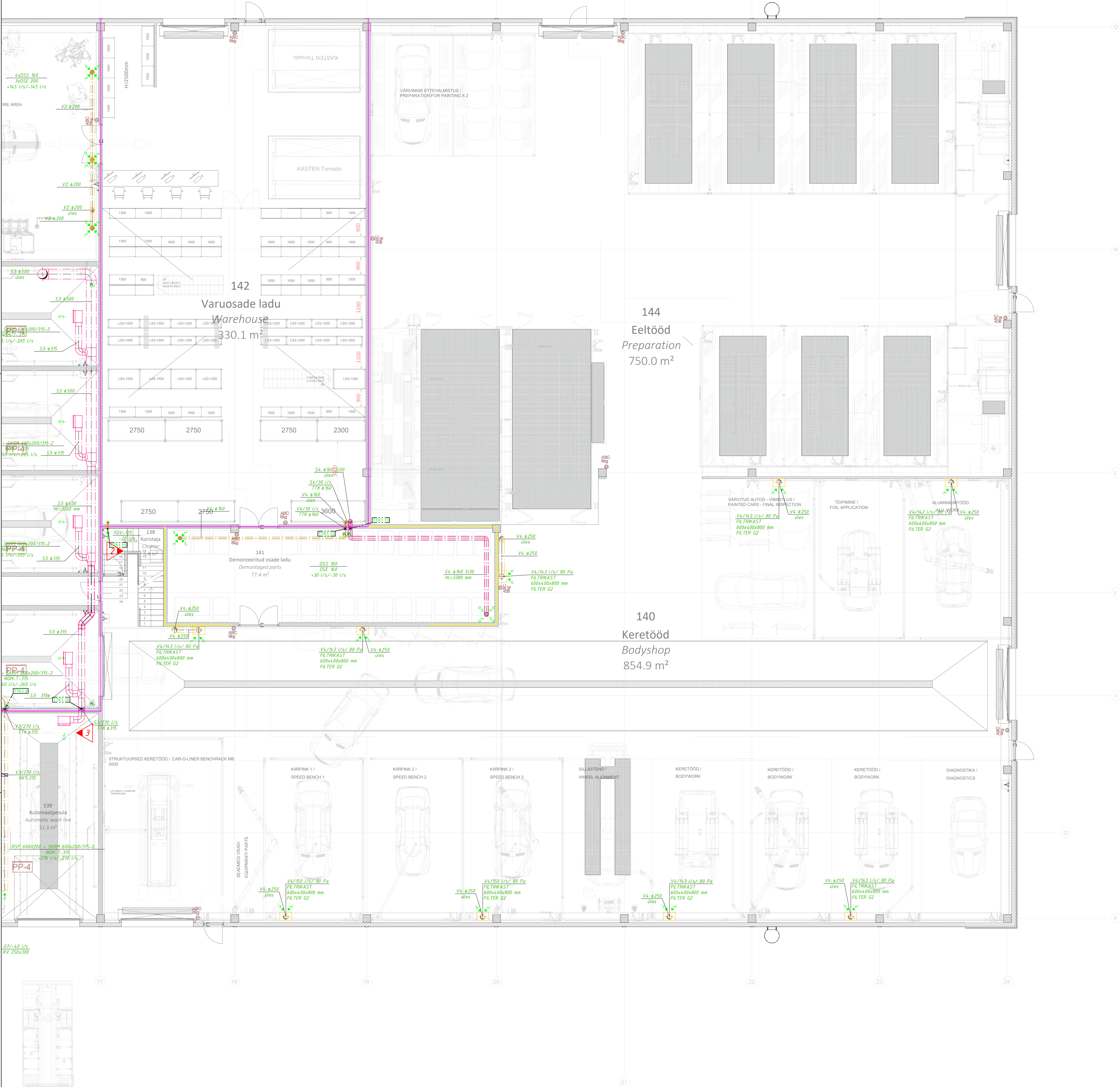
Läike tee 44 Veho teeninduskeskus Ventilatsioonisüsteemi tuletõkestite tabel